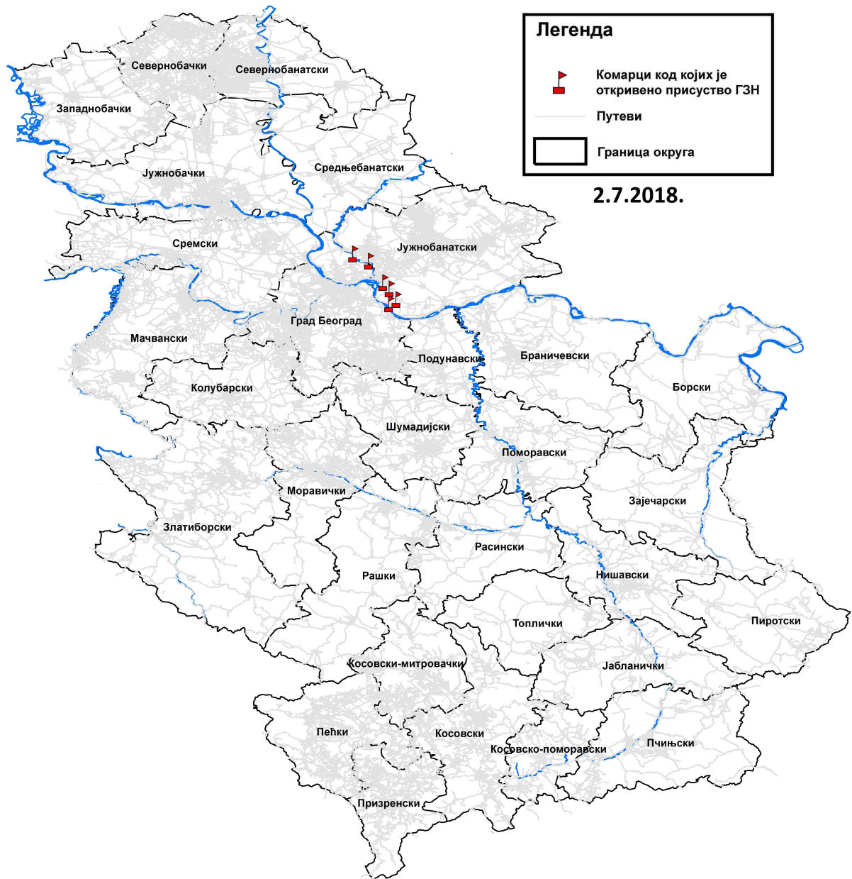
Мапа 2. Присуство вируса Западног Нила у узорцима комараца, Република Србија, сезона надзора 2018. години